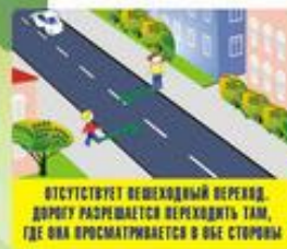
Отсутствует пешеходный переход, дорогу разрешается переходить там, где она просматривается в обе стороны