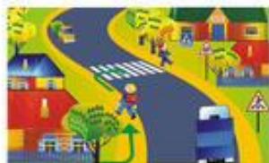
По обочине дороги следует идти навстречу движению транспорта