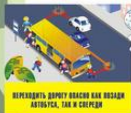
Переходить дорогу вблизи как позади автобуса, так и спереди

Чтобы возле перекрёстка Ты дорогу перешёл, Все цвета у светофора Нужно помнить хорошо! Загорелся красный свет — Пешеходам хода нет! Жёлтый — значит подожди, А зелёный свет — иди!