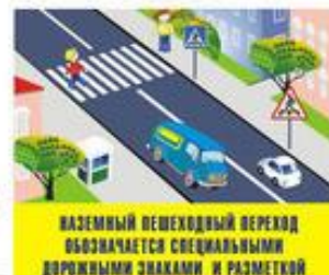
Наземный пешеходный переход обозначается специальными дорожными знаками и разметкой

Вот обычный переход. По нему идёт народ. Здесь специальная разметка, «Зеброю» зовётся метко! Белые полоски тут Через улицу ведут! Знак «Пешеходный переход» Где на «зебре» пешеход, Ты на улице найди И под ним переходи!