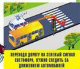
Переходи дорогу на зеленый сигнал светофора, нужно следить за движением автомобилей