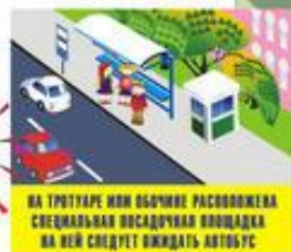
На тротуаре или обочине расположена специальная посадочная площадка на ней следует ожидать автобус