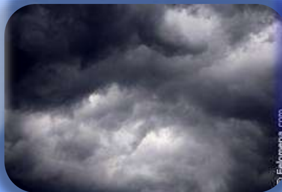
ОБЛАКА И ТУЧИ